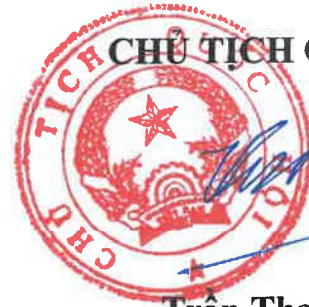
Trần Thanh Mẫn

Luật này được Quốc hội nước Cộng hòa xã hội chủ nghĩa Việt Nam khóa XV, kỳ họp thứ 7 thông qua ngày 28 tháng 6 năm 2024.